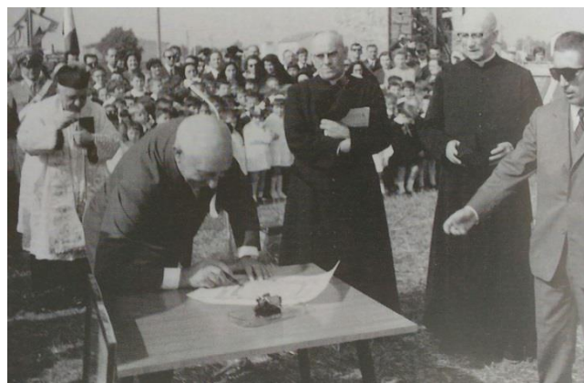
Firma della pergamena e posa della prima pietra della scuola materna - 8 ottobre 1967