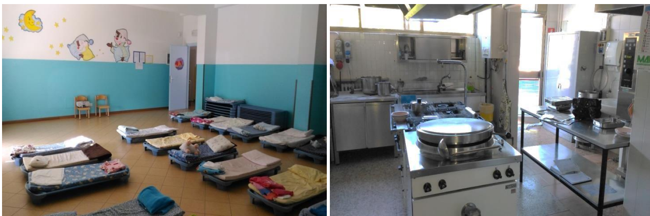
Stanze del riposo e cucina interna