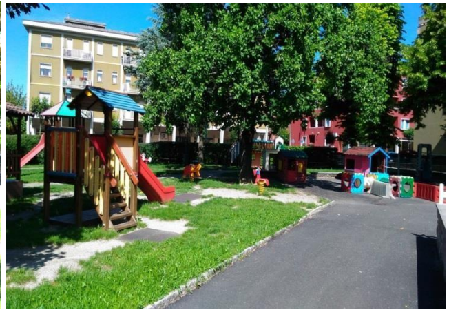
Giardino scuola dell'infanzia