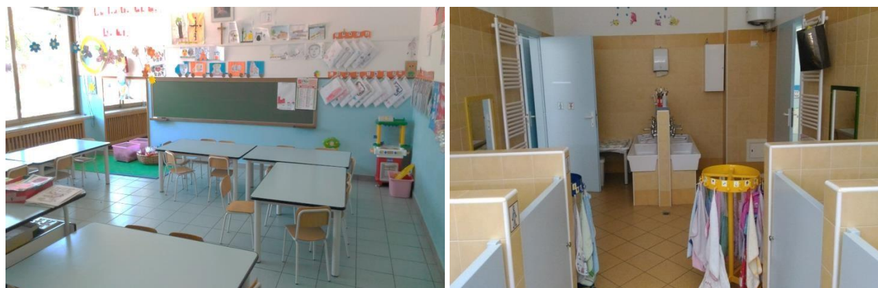
Sezione e servizi igienici