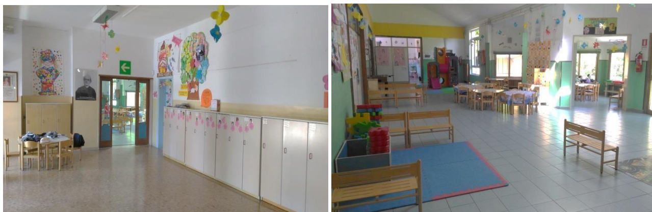
Atrio e salone centrale