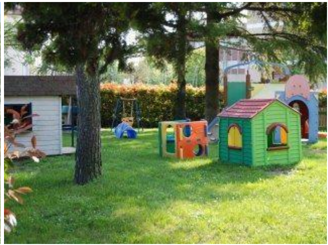
Giardino ed ingresso Nido integrato